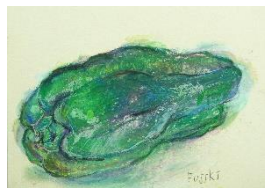
No.19 「ピーマンの量感画」

※本学本科卒業生及び履修証明プログラム修了者は1割引の14,850円(税込)となります。 申込時にお申し出ください。